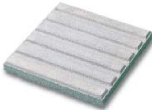
プレキャスト製品P-1型 幅300×長300×厚30m/m