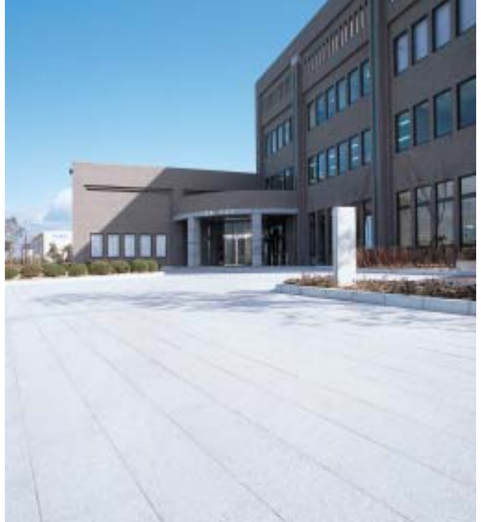
大阪府・貝塚文化センター